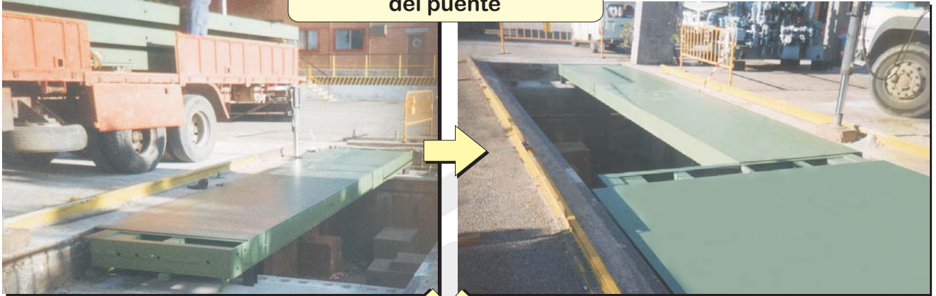
Diferentes fases de montaje del puente

Cada módulo esta compuesto por 3 vigas longitudinales unidas a la entrada, salida centro por 6 vigas transversales que evitas las flexiones producidas por las cargas que soportan.