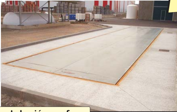
Instalación en foso