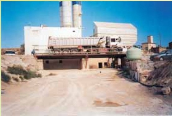
ARIDOS MONFORT,S.A. - San Juan del Moro, (Castellón)