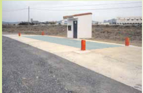
AYUNTAMIENTO DE CARIÑENA - Cariñena, (Zaragoza)