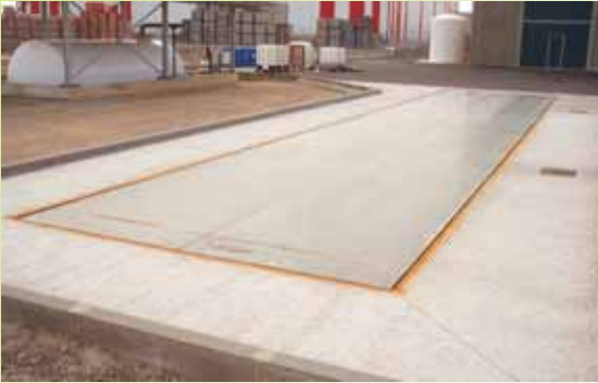
ITECO, S.L. - Zuera, (Zaragoza)