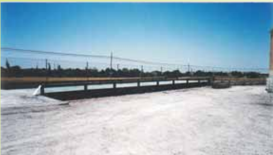
SESACOR, S.A. - Riber, (Lérida)