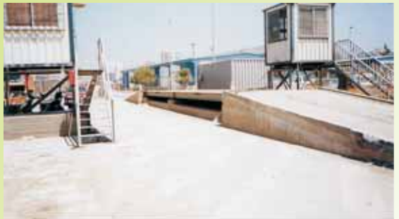
UTE DIQUE MÁLAGA- Puerto Málaga, (Málaga)