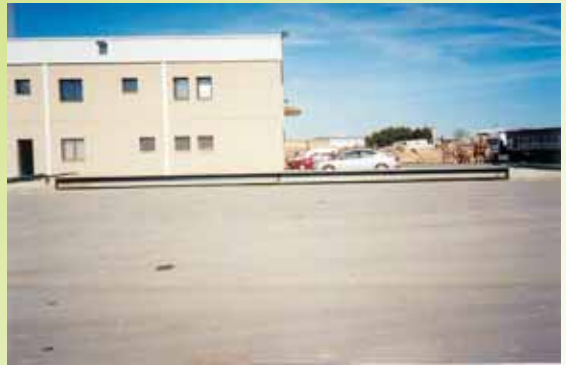
CIA. DE PIENSOS E INTEGRACIONES, S.A. - Altorricón, (Huesca)