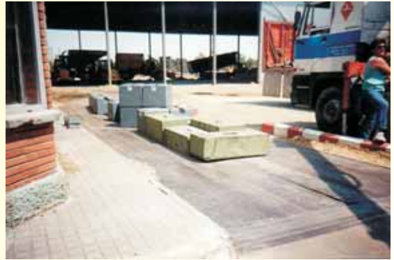
QUIMIDROGA, S.A. - Valdemoro, (Madrid)