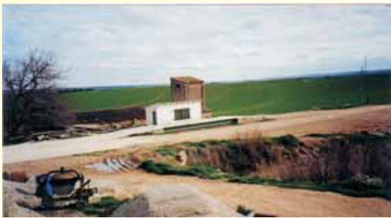
ORPELLA BERNAT E HIJOS, S.L. - Esplús, (Huesca)