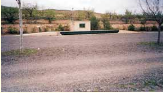
MESON DEL ACEITE - Bulbente, (Zaragoza)