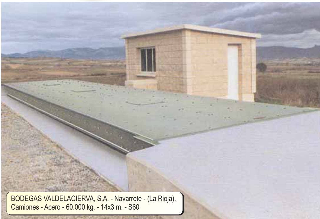
BODEGAS VALDELACIERVA, S.A. - Navarrete - (La Rioja). Camiones - Acero - 60.000 kg. - 14x3 m. - S60