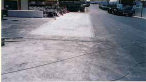
INTERNACIONAL OLIVARERA, S.A. - Dos Hermanas, (Sevilla)