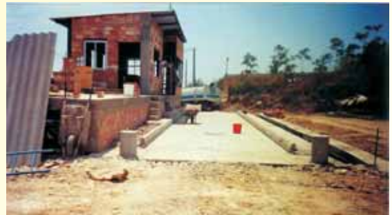
VERTEDERO MUNICIPAL DE VALENCIA - Ribarroja de Turia, (Valencia)