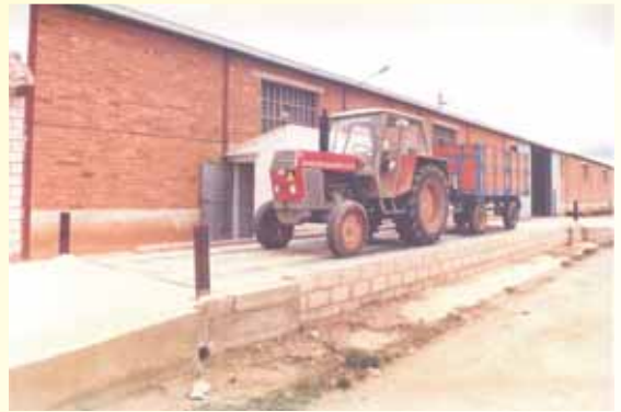
SECADERO DE GRANOS, S.A. - Aldeanueva de Ebro, (La Rioja)