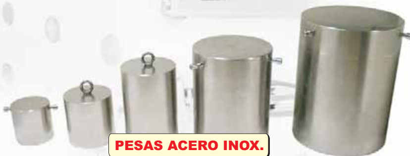
PESAS ACERO INOX.