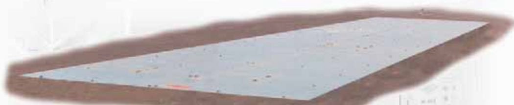
BÁSCULA ROMANA T90