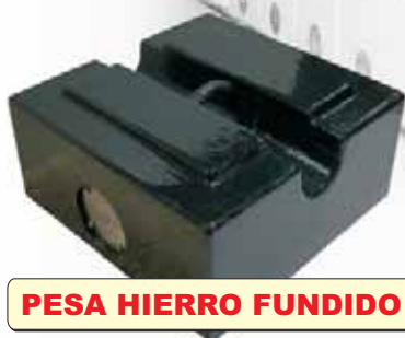
PESA HIERRO FUNDIDO