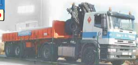
BÁSCULA MODULAR ELECTRÓNICA