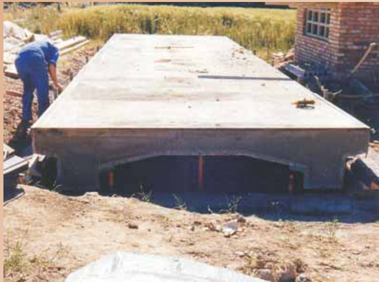
FINCA SAN LUIS - Huesca, (Huesca)